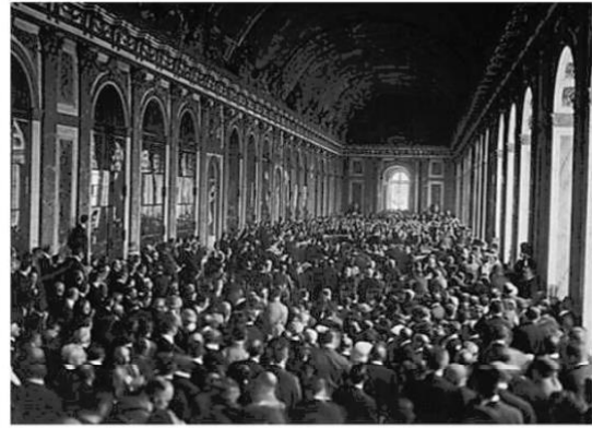
Doc C : Le traité de Versailles

Le traité de Versailles est signé le 28 juin 1919 dans la galerie des glaces du château. Il marque les conditions de la paix et rend l'Allemagne seule responsable de la guerre. Le traité impose à l'Allemagne de lourdes sanctions qui seront à l'origine de la montée du nazisme dans ce pays.