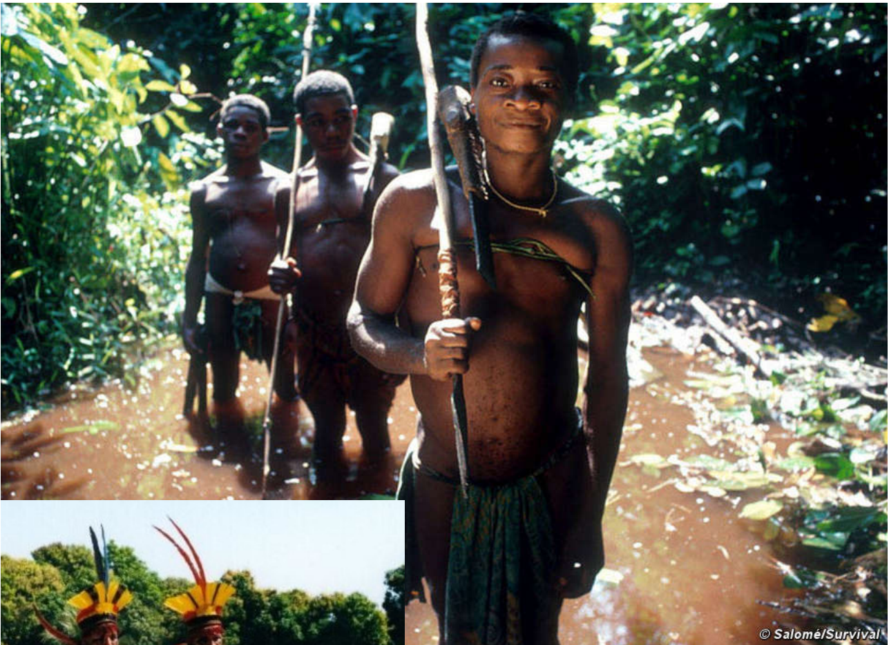
Des pygmées Aka (Afrique centrale)

Des tribus habitent ce monde extraordinaire. Elles vivent de la chasse, de la pêche et de la cueillette.