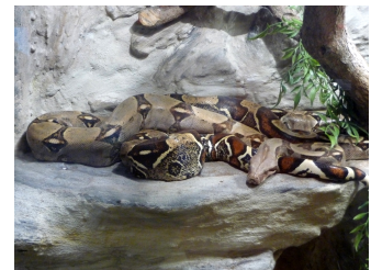
un boa constricteur

Des tribus habitent ce monde extraordinaire. Elles vivent de la chasse, de la pêche et de la cueillette.