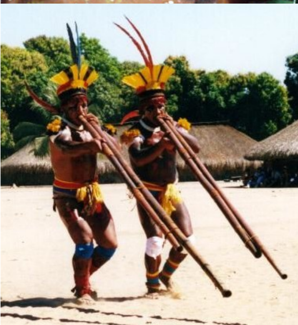
Le peuple Xingu (Brésil)