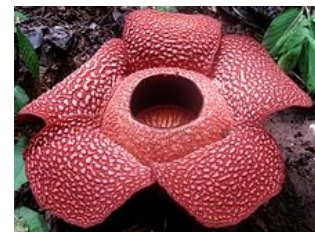
La rafflesia, la plus grande fleur du monde (Malaisie)

Des lianes pendent des arbres. Des plantes, parfois étonnantes, poussent dans cette terre humide.