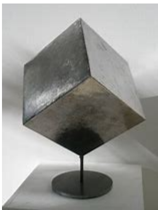
cube d'acier Philippe Lonzi

Rechercher dans la maison des pavés, des cubes et m'envoyer une photo des objets trouvés.